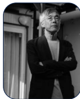
高橋 源一郎 (たかはし げんいちろう) (作家)

1982年「さよならギャングたち」でデビュー。小説、評論、競馬予想、翻訳、等を発表。2005年～2019年、明治学院大学国際学部教授。現在、NHKラジオ第一「高橋源一郎の飛ぶ教室」パーソナリティー。