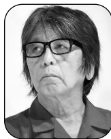
森 達也 (もり たつや) (映画監督、作家)

1956年広島県生まれ。映画監督、作家、明治大学特任教授。98年、オウム真理教を取り巻く社会の歪みを描いたドキュメンタリー映画『A』を公開。その後、『A2』、『FAKE』などを経て2019年公開の『i-新聞記者ドキュメント-』がギネマ旬報ベストテン(文化映画)1位を獲得。『A3』(第33回講談社ノンフィクション賞受賞)ほか著書多数。23年9月には初の劇映画『福田村事件』を公開。